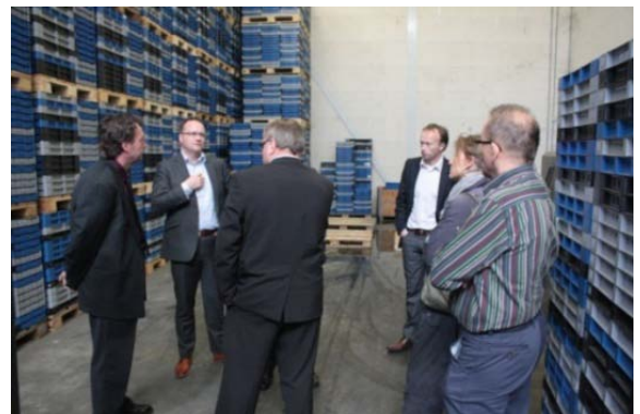
Bedrijfsbezoek Lean Logistics bij Veenstra|Fritom